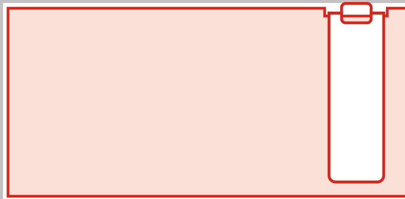
karta v kompletu se záložkou